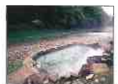
川湯温泉露天風呂