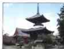
開祖が眠る高山寺

※お願い/このご旅程は運輸機関のダイヤ改正及び各地の道路状況により多少時間が変更になる場合がございます。