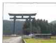
演武会場となる大斎原