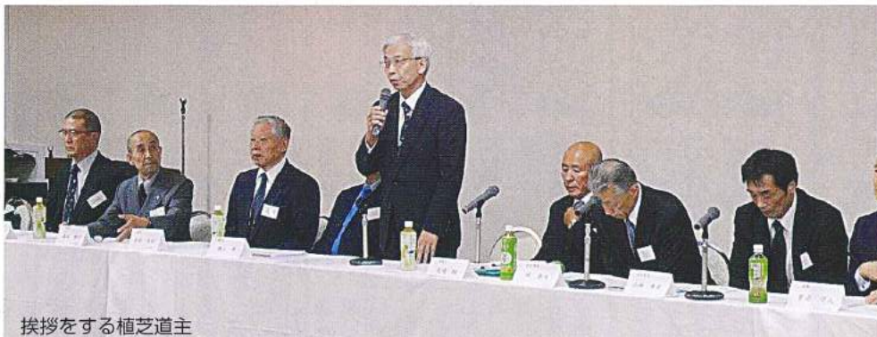
挨拶をする植芝道主