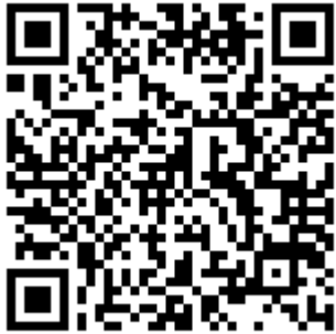
申込フォーム QR コード